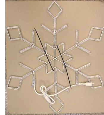
MODEL : FCB-XM-MK0249-120V-W size: 26 inches Item No: 82024LO