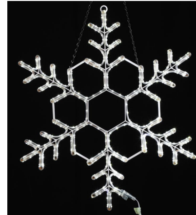
Model No.: FCB-XM-MK0248 Item No. : 82239LC size: 30 inches

This Class [B] RFLD complies with Canadian ICES-005. Ce DEFR de la classe [B] est conforme à la NMB-005 du Canada. Model No.: FCB-XM-MK0249 Item No. : 82239LC size: 26 inches